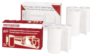
Thermopapier "eco" und "top"